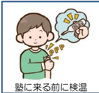
塾に来る前に検温