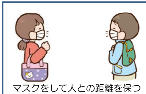
マスクをして人との距離を保つ