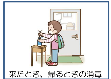
来たとき、帰るときの消毒